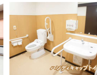
ハンディキャップトイレ